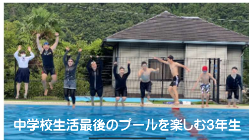
中学校生活最後のプールを楽しむ3年生