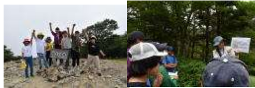
5・6年野外観察学習会(大台ヶ原)のようす

私事で恐縮ですが、8月11日に教員生活で最後の担任をしたクラスの同窓会がありました。中学校を卒業して10年目の25歳になる年の夏にみんなでタイムカプセルを開けるという集まりです。タイムカプセルには10年後の自分に宛てた手紙が入っていて、みんな懐かしそうに読んでいました。タイムカプセルにまつわる思い出はいろいろありますが、埋めた場所がわからなくなるということがよくあります。私は以前十津川村の学校に勤務していました。初めて担任をしたクラスで、卒業を迎えるにあたりタイムカプセルを校庭に埋めました。5年後、成人式で集まった時に掘り返そうとなり、掘ったのですが見つかりませんでした。数カ所掘ったのですが、出てきません。仕方なくタイムカプセルをあきらめることになりました。月日は経って昨年、当時の生徒から電話をもらいました。勤務していた学校(木造校舎)が2025大阪万博で展示されることになり(映画監督の河瀬直美さんが企画されました)、解体作業中に天井裏からタイムカプセルが出てきたという連絡でした。30年間タイムカプセルは見つけれられるのを待っていたのでしょうか。移築の話がなければ見つけれなかったかもしれません。連絡をくれた生徒とは懐かしい話や同級生の話で盛り上がり、私にとっても本当のタイムカプセルが開いたように感じました。電話をくれた生徒は今47歳ですが、私の頭の中では15歳の「のんちゃん」と話をしていました。来年2025大阪万博が開催されますが、私は木造校舎との再会を楽しみにしております。