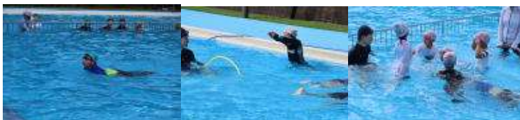
水泳発表会のようす

41日間の夏休みも終わり、いよいよ2学期がスタートしました。夏休み中にはパリオリンピックが開催され、アスリートの活躍に一喜一憂し、勝ち負け、メダルに関係なくアスリートの皆さんからは素敵な感動と勇気、エネルギーをいっぱいもらいました。オリンピックに負けじと、前期課程の児童も7月26日に水泳発表会を行い、体育の時間や水泳教室で培った力を発揮しました。自分で決めた目標にチャレンジし、見事目標を達成していました。ユニークなチャレンジ「15分間浮遊」など見応えがあり、いずれの発表者にもみんな大きな声援を送り、その声援に応えようと全員頑張っていました。暑期中、応援に来てくださったご家族の皆様ありがとうございました。また後期課程の卓球部も県総体や選手権大会に出場し、日頃の練習で培った力をぶつけていました。上手くいったところ、いかなかったところいろいろあると思いますが、一つ一つの試合や経験を大切に次につなげ、自分の力として行ってほしいです。台風10号の影響で、予定されていた後期課程のラフティング体験や美術部の校外学習が中止となり、残念な思いでいっぱいですが、子ども達はこの夏休み中にいろいろな経験や思い出を積み上げたと感じています。その力が2学期の学校生活にも活かされることを期待しています。